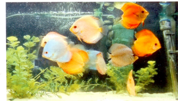
¡La acuaríofilia puede ser así de sencilla!

Cambiar un 10 a un 20% del agua una vez por semana, o bien , un 30% del agua una vez cada dos semanas, al mismo tiempo eliminar las algas, limpiar las placas (simplemente con un rascador) y aspirar los restos de suciedad del fondo con un tubo sifonador.